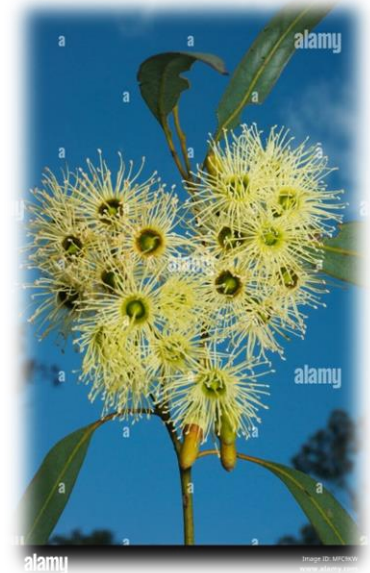
Une fleur d'eucalyptus: