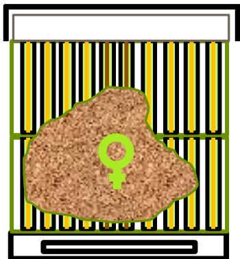
Ruche en septembre

Nouvelle hausse contenant quelques cadres bâtis et des cires gaufrées