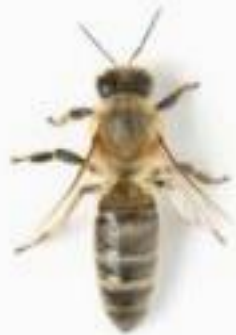
Abeille domestique ( Apis mellifera )