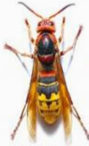
Frelon européen ( Vespa crabro )