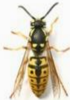
Guêpe commune ( Vespa vulgaris )