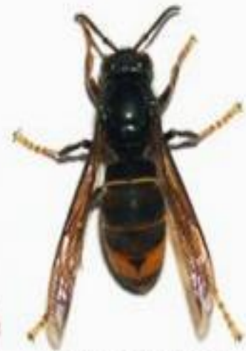
Frelon asiatique ( Vespa velutina )