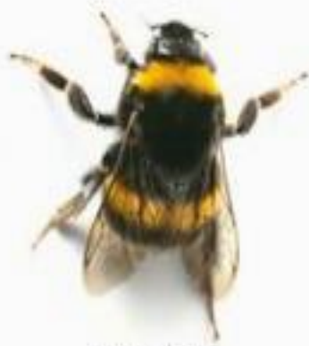
Bourdon terrestre ( Bombus terrestris )